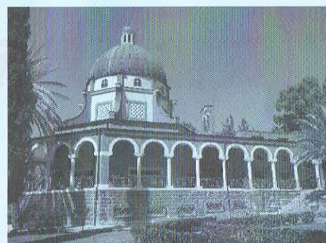
山上の垂訓教会(祝福の丘 ガリラヤ)

出発前に頭金として総費用の10%以上をお支払いいただければ、残りの費用は帰国後の分割払い。手続きも簡単です。詳細はお気軽にお問い合わせください。