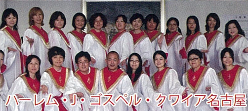
ハーレム・J・ゴスペル・クワイア名古屋