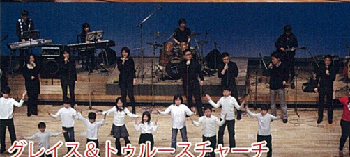
グレイス&トゥルースチャーチ