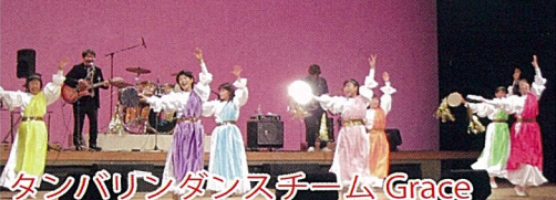
タンバリンダンスチーム Grace