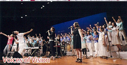
Voices of Vision