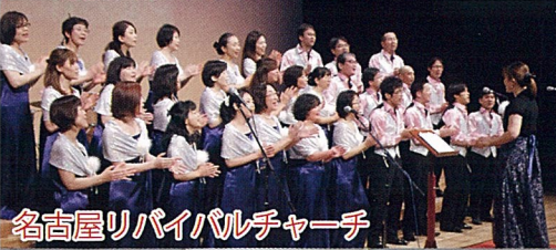
名古屋リバイバルチャーチ