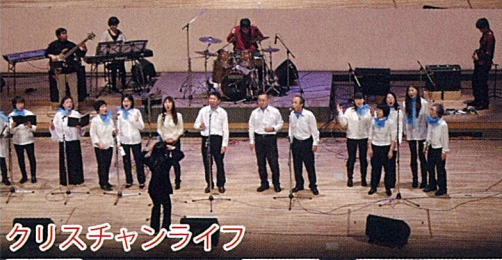
クリスチャンライフ