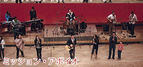
ミッション・アポイオ