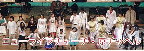
ニューライフチャーチ・原チャペル