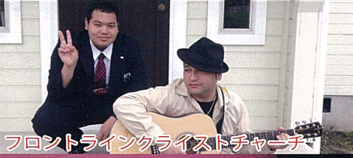
フロントラインクライストチャーチ