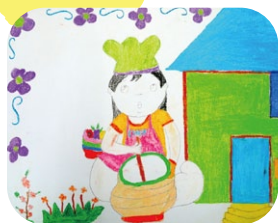
フィリピン・12歳の子どもの夢 「コックさんになりたい」

世界食料デーは世界の食料問題を考える日。 食べられるって、あたりまえのこと? わたしたちが食べられればそれでいいのかな? 日々、食べられることに感謝を込めて、 子どもたちが絵を描きました。