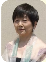
サクソフーン・ボーカル

小牧市在住の演奏家を中心に結成された音楽家演奏グループ“ポルタメント小牧”が多彩な音色をお届けします。