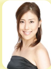
オーボエ・ボーカル

ボイストレーナーとして活動。平成24年まで岐阜県能力開花支援事業で音楽指導者として多数の小中学校で指導。ラ・プリマ、キッズ・ラプリマを結成、施設や小牧市口ピアコンサートで演奏活動を行う。